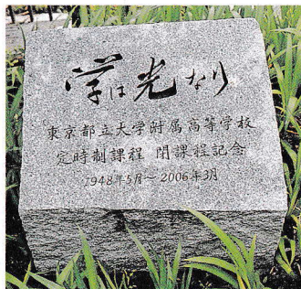
↑定時制課程閉課程記念碑 ←ブレザーとタータンチェックのスカートが 評判の桜修館の制服(学校説明資料より)